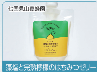
七国見山養蜂園 藻塩と完熟檸檬のはちみつゼリー