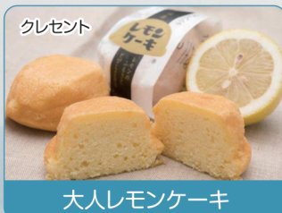
クレセント 大人レモンケーキ