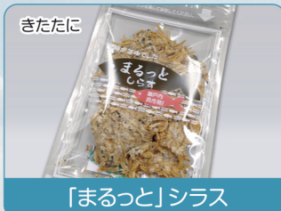
きたたに 「まるっと」シラス