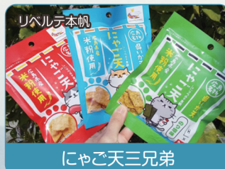
リベルテ本帆 にゃご天三兄弟