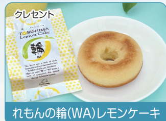
クレセント れもんの輪(WA)レモンケーキ