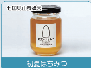
七国見山養蜂園 初夏のはちみつ