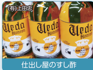
(有)上田忠 仕出し屋のすし酢