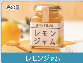
島の屋 レモンジャム

会期を通じた、 呉市の豊富な地域資源である、 “うみのさち”“やまのさち”を選びすぐった食材をつかった、 知る人ぞ知る 人気の特産品を集めた物産フェア です。