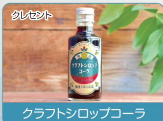
クレセント クラフトシロップコーラ