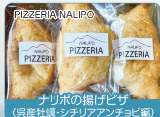
PIZZERIA NALIPO ナリポの揚げピザ (呉産牡蠣・シチリアアンチョビ編)